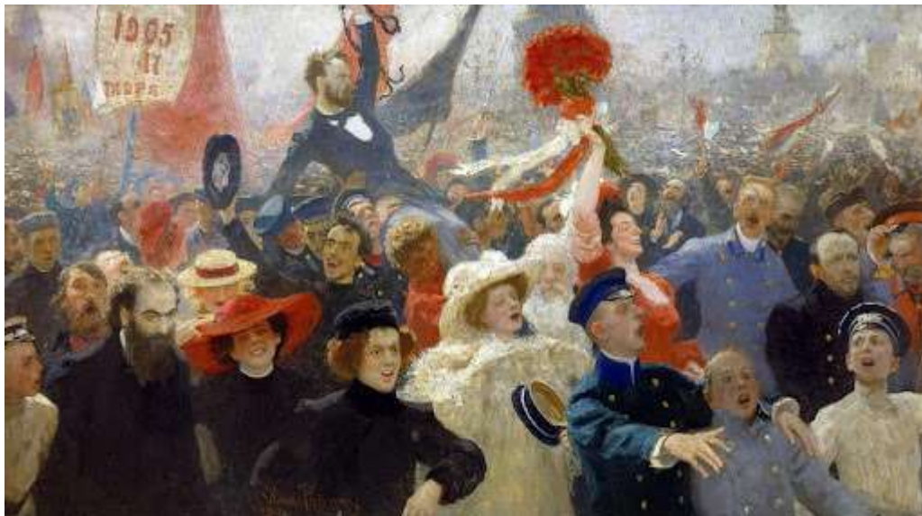
«17 октября 1905 года». И. Е. Репин

Председателем партии стал П. Н. Милуков. Её сторонниками были служащие, интеллигенция, земские либералы. Численность партии достигала 60 тыс. человек. Печатным органом кадетов стала газета «Речь».