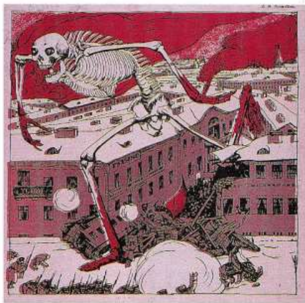
«Жупел революции». Б. М. Кустодиева

Вскоре после 17 октября Всероссийская политическая стачка закончилась. Эсеры распустили Боевую организацию. Но это вовсе не означало, что революция была окончена. 26 октября вспыхнуло восстание в Кронштадте, которое власти подавили через три дня. Петербургский Совет объявил забастовку в знак протеста. Правительство остановило производство на значительной части заводов. Совету пришлось отказаться от забастовки — рабочие остались без средств к существованию.