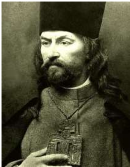
Г. А. Гапон

В декабре 1904 г. с Путиловского завода уволили нескольких рабочих. Они состояли в легальной организации «Собрание русских фабрично-заводских рабочих г. Санкт-Петербурга», которую поддерживала власть. Организацию возглавлял священник Георгий Аполлонович Гапон (1870–1906). Он обратился к руководству завода с просьбой восстановить уволенных, но получил отказ. В ответ 3 января 1905 г. рабочие Путиловского завода начали забастовку. Их поддержали на других заводах, и к 7 января стачка охватила весь город.