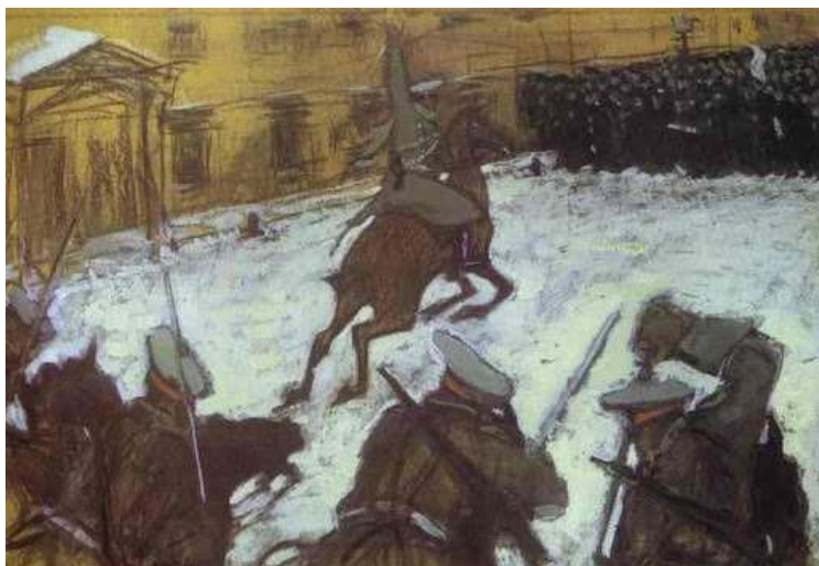
«Солдатушки, бравы ребятушки, где же ваша слава?». В. А. Серов. 1905

Как мы помним, некоторые партии считали наиболее эффективным методом реализации своих программ вооружённую борьбу. В декабре 1905 г. Петербургский совет рабочих депутатов готовился к организованному вооружённому выступлению. Его возглавил Лев Давидович Троцкий (1879–1940). В начале декабря Петербургский совет призвал население не платить налоги и забирать вклады из банков, за что на следующий день в полном составе был арестован.