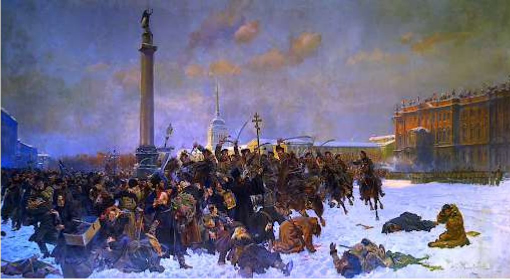
«Кровавое воскресенье». В. Коссак

Высказывалась версия, что Гапон сознательно спровоцировал столкновение между рабочими и властями. Он сумел скрыться и покинул Россию, позже примкнул к большевикам, затем к эсерам, а в конце 1905 г. вернулся на родину и попытался сотрудничать с полицией, за что его и повесили революционеры.