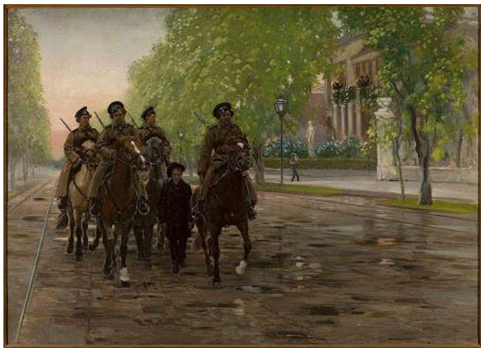
«Весна 1905 года». С. Масловский

12 мая началась забастовка в Иваново-Вознесенске. В ней приняли участие более 70 тыс. рабочих. Они создали первый общегородской Совет рабочих депутатов, половина из которых была большевиками.