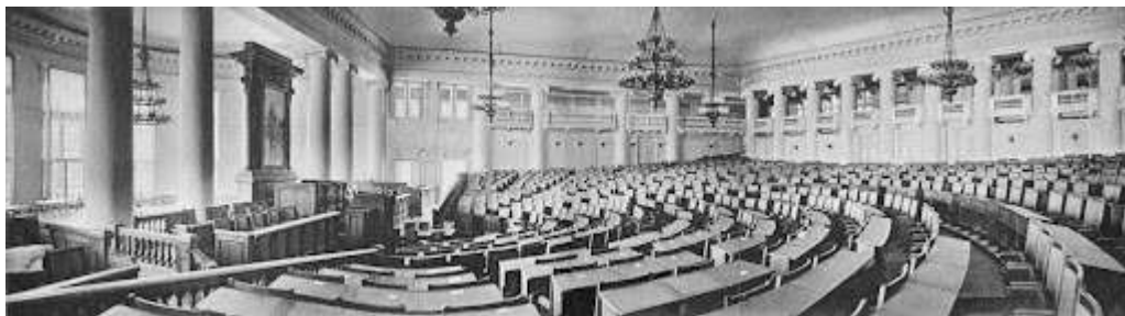
Зал заседаний Государственной думы в Таврическом дворце, Санкт-Петербург

были базовые права: неприкосновенность личности, жилища, свобода слова, собраний, союзов, возможность выезжать за границу. Однако разрешение на проведение собраний нужно было получать в полиции, а деятельность любого союза могла быть запрещена.