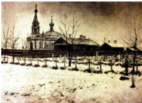
Могилы жертв Кровавого воскресенья на Преображенском кладбище под Санкт-Петербургом

По всей стране вспыхивали забастовки. Известно, что в первой половине 1905 г. в них приняли участие более 800 тыс. человек. На забастовках звучали политические требования. Волнения охватили западные и южные окраины страны: Польшу, Прибалтику, Грузию. В них участвовали крестьяне, которые силой отбирали у помещиков землю, инвентарь и скот. К протестам подключились студенты. Волнения происходили и в армии, но пока не массовые. Потрясением для консерваторов стало 4 февраля 1905 г.: от взрыва бомбы, которую подбросил эсер, погиб генерал-губернатор Москвы великий князь Сергей Александрович, дядя императора.