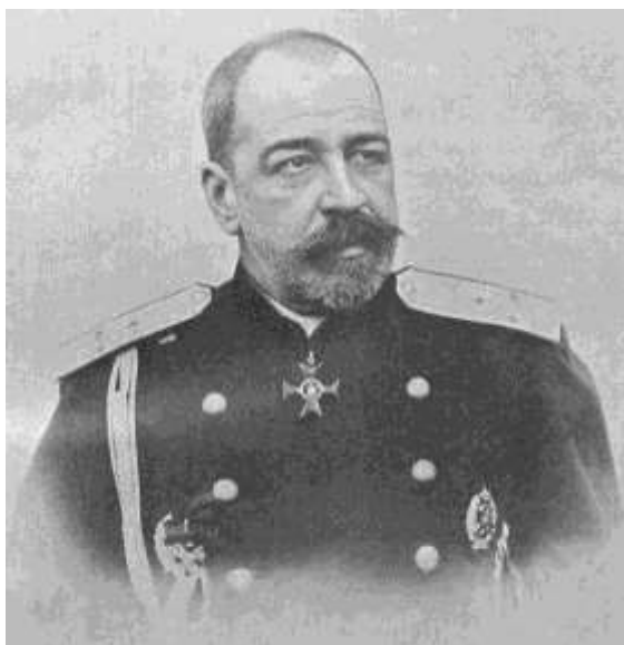
П. Д. Святополк-Мирский

Съезд провели нелегально. После этого в крупных городах России прошла так называемая «банкетная кампания»: в честь 40-летнего юбилея судебной реформы члены «Союза освобождения» устроили банкеты, на которых произносили политические речи, замаскированные под тосты. В них звучали открытые призывы к свержению самодержавия.