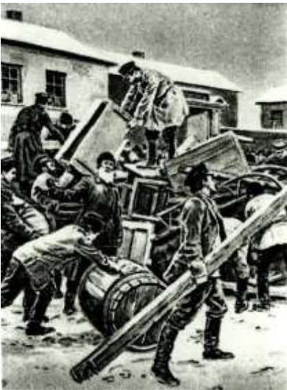
Баррикады на Васильевском острове. Рисунок Фрэнка Дадда. 1905

11 января 1905 г. генерал-губернатором Санкт-Петербурга был назначен Д. Ф. Трепов. Ему поручили подавить сопротивление восставших, которые устроили баррикады на Васильевском острове. По столице прокатились массовые аресты. 19 января Николай II принял в Царском Селе делегацию рабочих и сообщил, что прощает их за события 9 января. Император искренне считал, что этого достаточно, чтобы беспорядки прекратились.